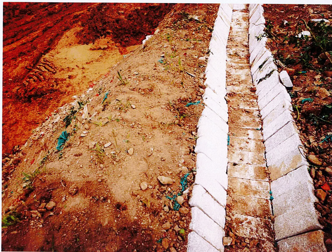
基坑顶部的排水沟整改后