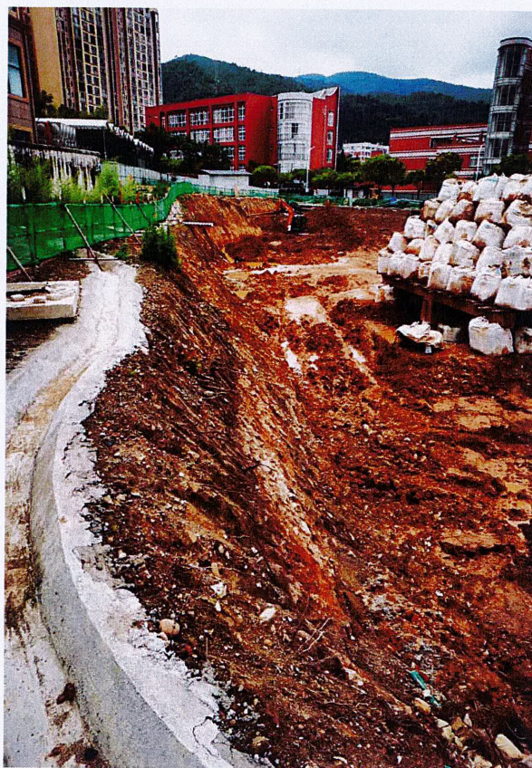
部分边坡土质较差整改后