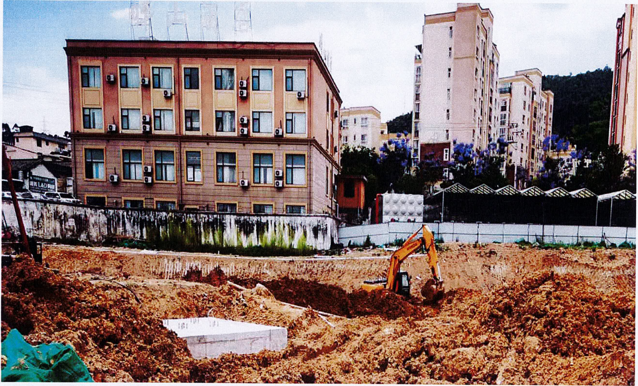
基坑南侧、西侧未安装防护栏杆整改后