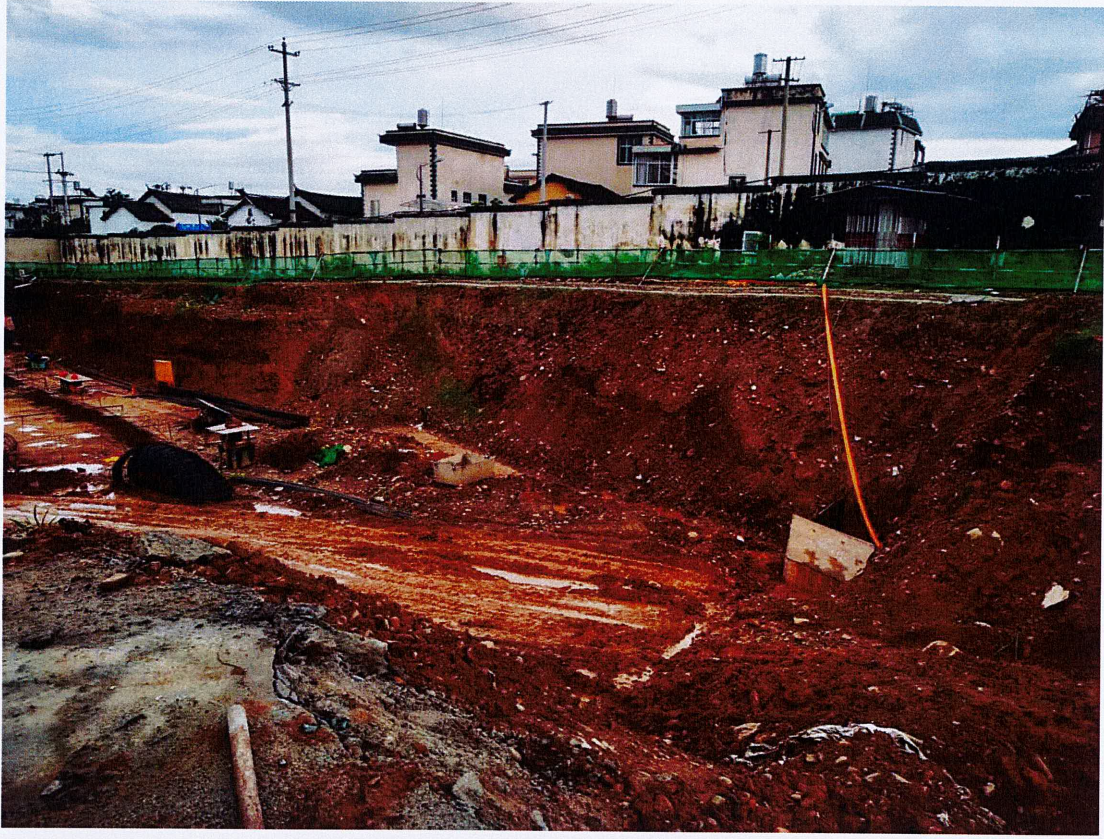
部分边坡放坡坡度不满足方案要求整改后