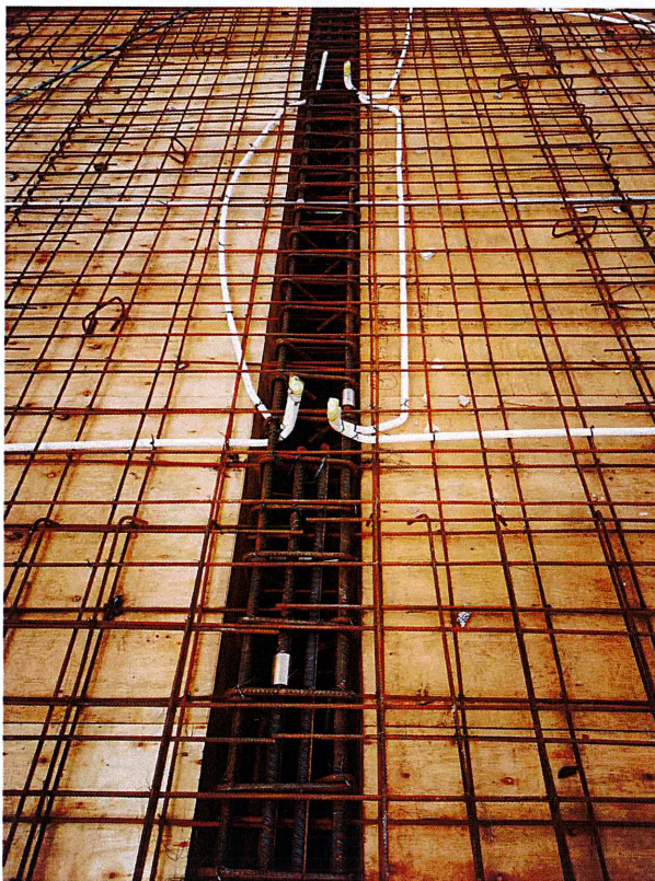
部分梁骨架偏移、位移整改后