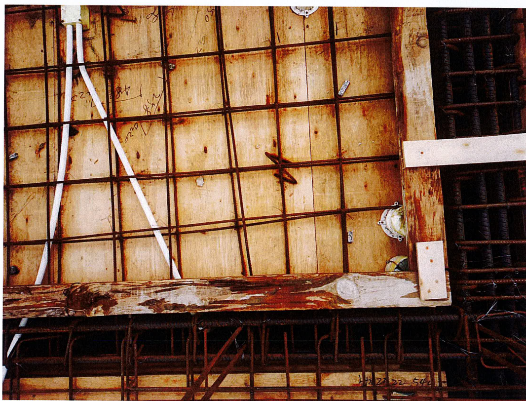
部分板底部钢筋网眼尺寸偏差较大整改后