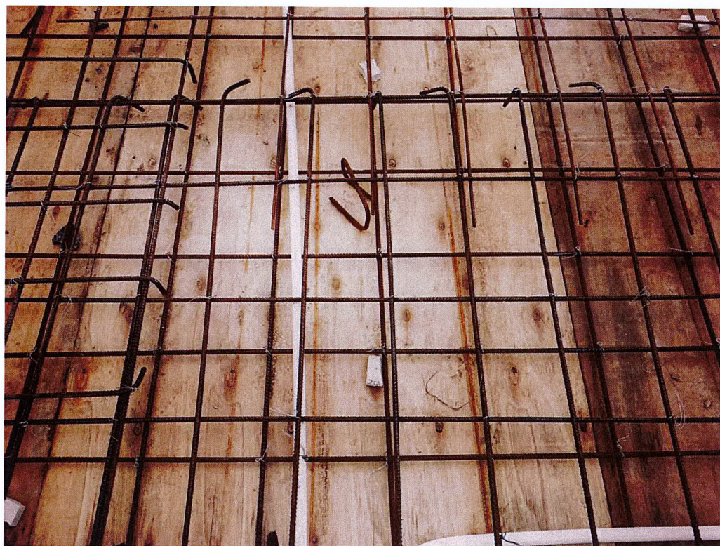
部分板面负弯矩钢筋板扎不规范整改后