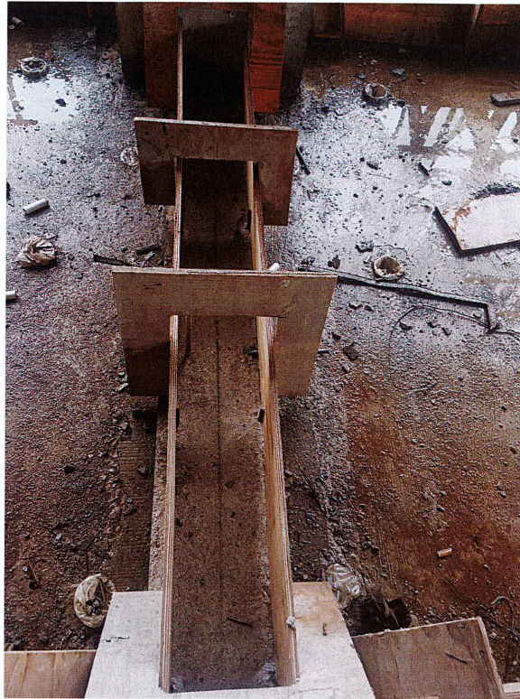
二楼卫生间四周混凝土翻边施工缝处理不符合要求整改后